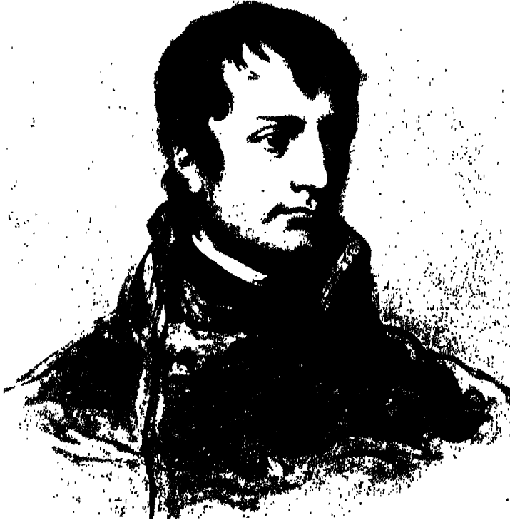
نابليون بونابرت في سن الرجولة.

بكي قصر مارسان موت دوق بيري، وبموته فقد آخر أمل للفرع المسمى «بالشرعي». تلك ضربة من بونابرت، بونابرت بذاته..! خيمت ظلال «الغاصب» إذن، بشكل دائم على «السير» وعائلته الشهيرة، ملوك الحق الإلهي لفرنسا الخالدة؟